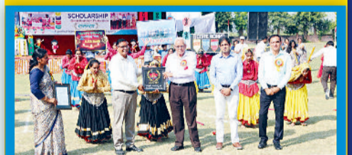
Felicitations of the Chief Guest on Annual Function at Dadri Branch