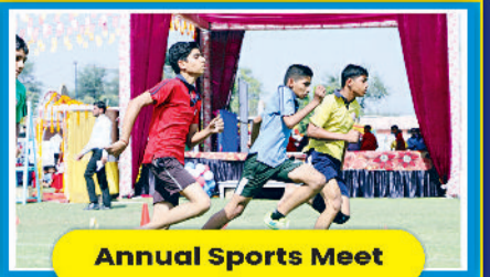
Annual Sports Meet

For Online Registration visit : www.redschools.org Contact us : 9992114101 (Chhuchhakwas) 9992600417 (Jhajjar), 9992113926 (Dadri)