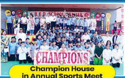
Champion House in Annual Sports Meet