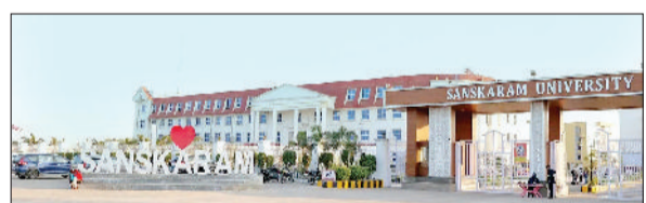
झज्जर। संस्कारम् विश्वविद्यालय का फाइल फोटो।