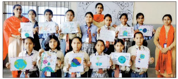
झज्जर। विश्व जल दिवस पर आयोजित स्लोगन राइटिंग प्रतियोगिता के प्रतिभागी।