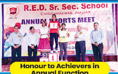
Honour to Achievers in Annual Function