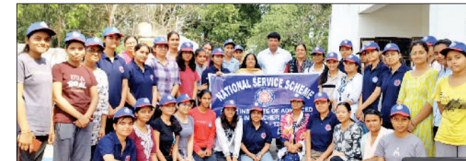
झज्जर। शिविर में शिक्षकों के साथ उपस्थित स्वयंसेविकाएं।