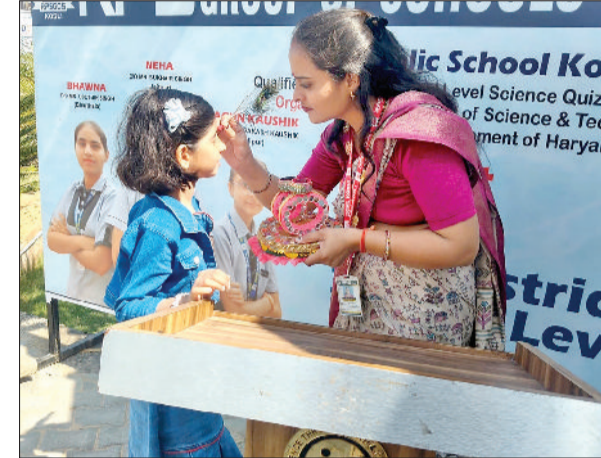
झज्जर। टेस्ट देने पहुंचे विद्यार्थियों को तिलक लगाते हुए शिक्षिका।