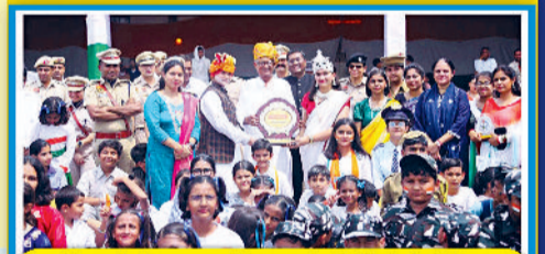
Receiving an Award at District for Best Programme on Independence Day