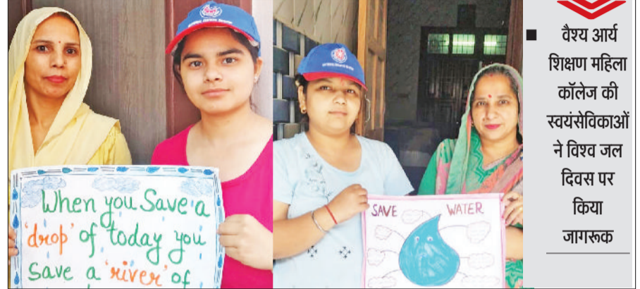
बहादुरगढ़। अपने परिजनों को जल संरक्षण का संदेश देती स्वयंसेविकाएं।