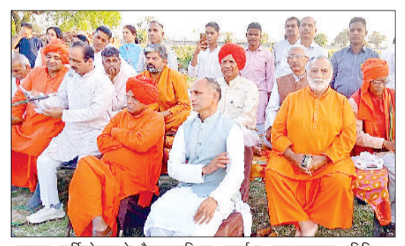
झज्जर। वार्षिकोत्सव के दौरान उपस्थित आचार्य व अन्य गणमान्य अतिथि।