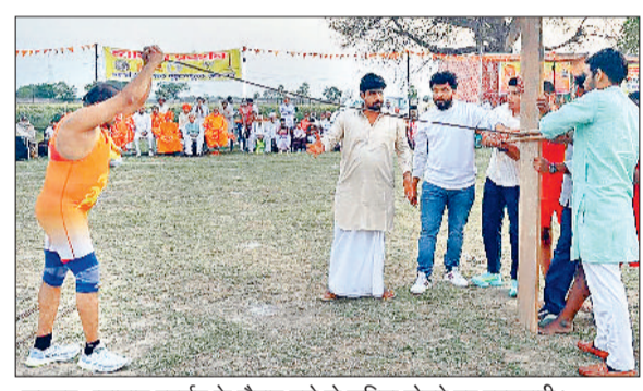
झज्जर। व्यायाम प्रदर्शन के दौरान गले से सरिया मोड़ते हुए ब्रह्मचारी।