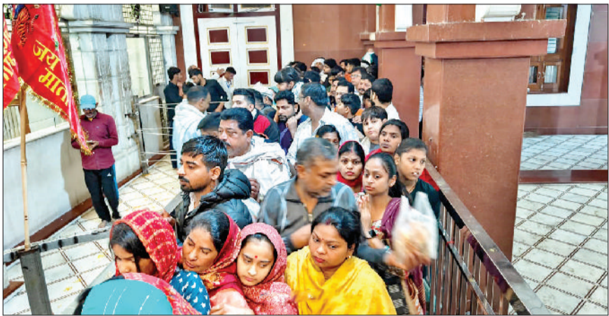
झज्जर। माता भीमेश्वरी देवी की प्रतिमा, दर्शन करने के लिए उमड़ी लोगों की भीड़।