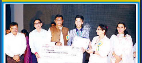
1st Position in Declamation at District Youth Festival