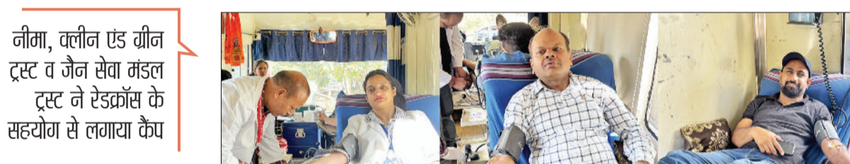
बहादुरगढ़। रविवार को लगे कैप में रक्तदान करते जागरूक नागरिक।

नौमा, वलीन एंड वीन ट्रस्ट व जैन सेवा मंडल ट्रस्ट ने रेडक्रॉस के सहयोग से लगाया कैप हरिभूमि न्यूज ▶▶ बहादुरगढ़