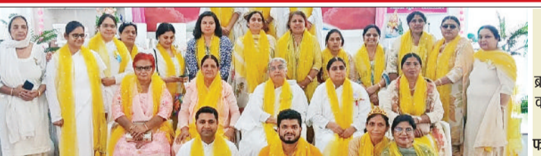
बहादुरगढ़। कार्यक्रम में शामिल ब्रह्माकुमारियों व गुरुकुल की पूर्व छात्राएं।