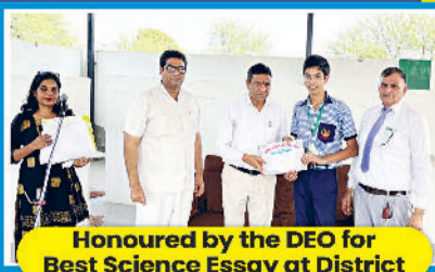
Honoured by the DEO for Best Science Essay at District